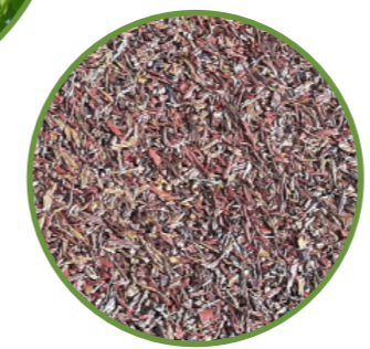
Rubberen snippers om slijtplekken in het gras te voorkomen