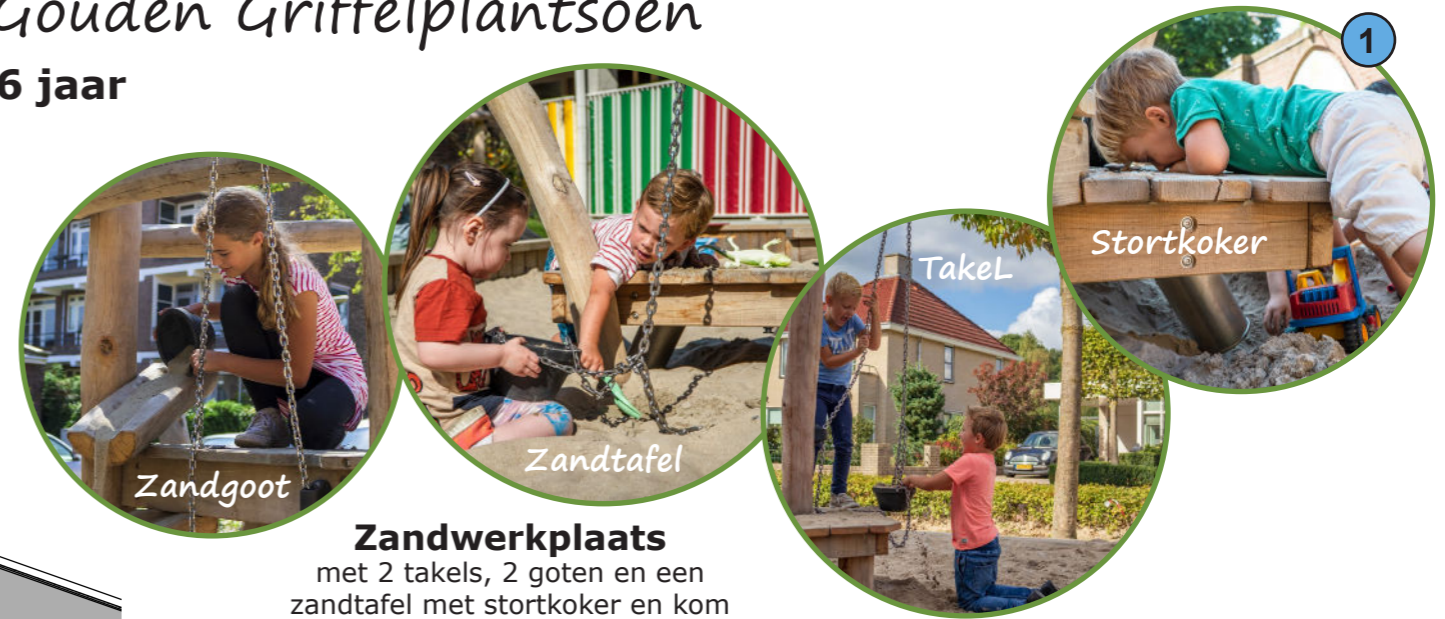
Zandwerkplaats met 2 takels, 2 goten en een zandtafel met stortkoker en kom