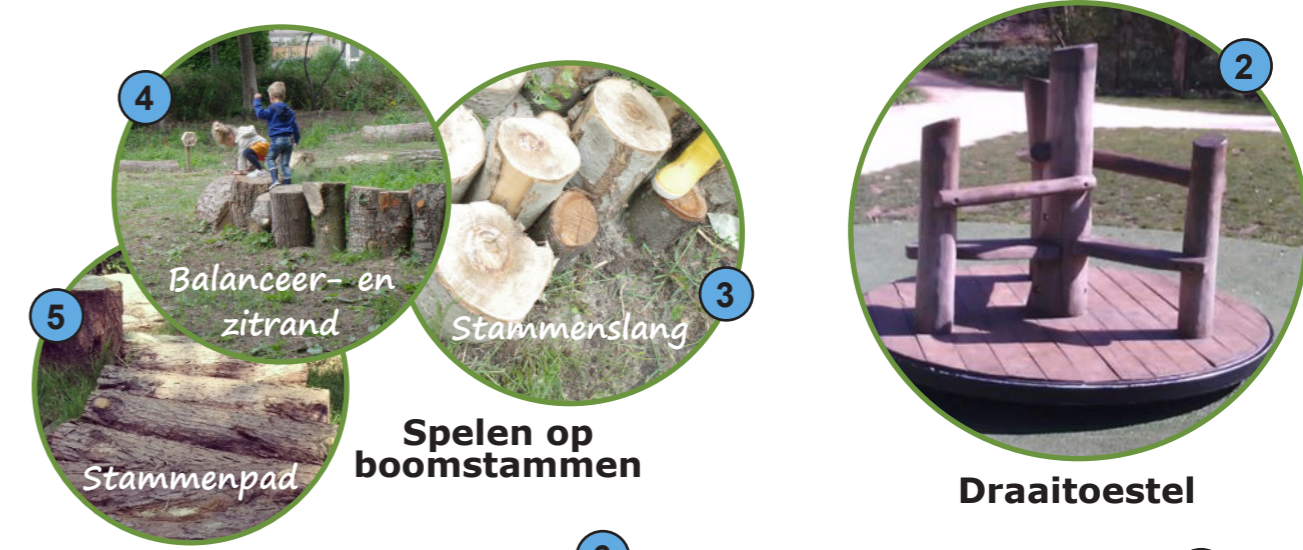
Spelen op boomstammen