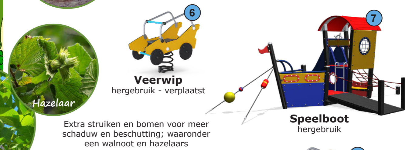
Veerwip hergebruik - verplaatst