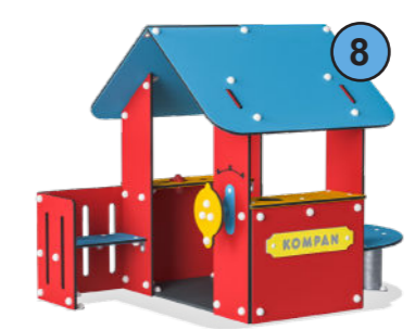
Speelhuisje hergebruik - verplaatst