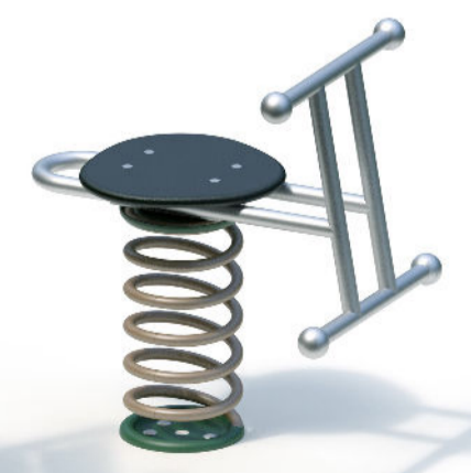
5 0-44205-000 VEERELEMENT