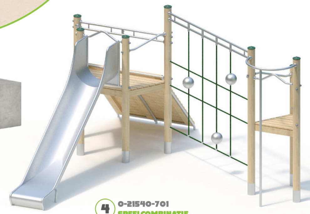
4 0-21540-701 SPEELCOMBINATIE