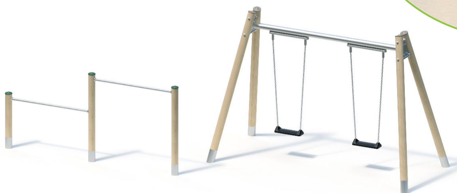
1 0-53215-700 DUIKELREK (0,90; 1,50 M.)