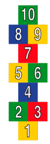
6 P118 PLEINPLAKKER HINKELPAD