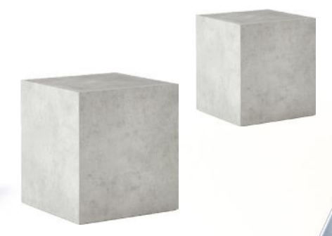
3 BETONNEN POEFS